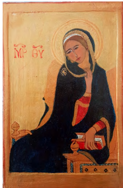
Moeder Gods van de aankondiging

Openingstijden: zondag na de kerkdienst, van 11:15 tot 12:15 dinsdag van 10:00 tot 12:00