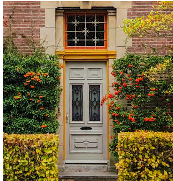
De nieuwe situatie

Het zal de oplettende kerkganger niet zijn ontgaan: de pastorie heeft een andere grote voordeur. De originele deur is in de jaren 70 vervangen door een blank gelakte teakhouten deur met drie grote ruiten. Op zich was dit geen lelijke deur, maar karakterloos bij de gevel van de pastorie. Een reconstructie van de oorspronkelijke deur was niet haalbaar.