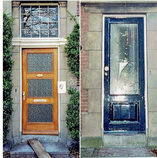
Oude situatie met rechts de 'kleine voordeur'