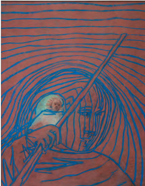
"Dragen en gedragen worden"