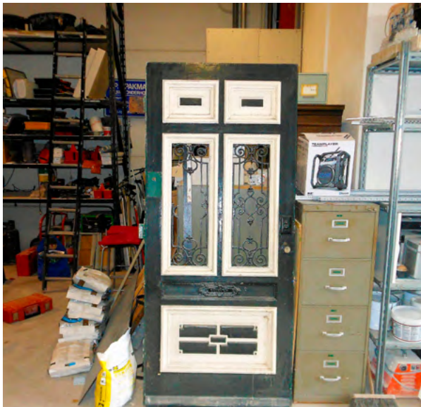
De 'gevonden' deur